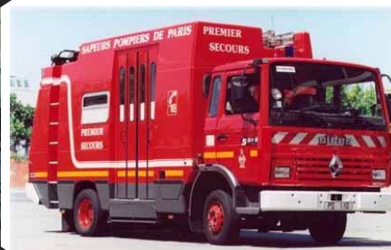
Fourgon premier secours

Il n'y a plus de centre de secours Sèvres, mais un simple « poste » de secours.