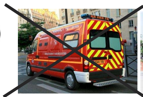
VSAV - Véhicule de Secours Aux Victimes