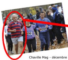
Chaville Mag - décembre 2010